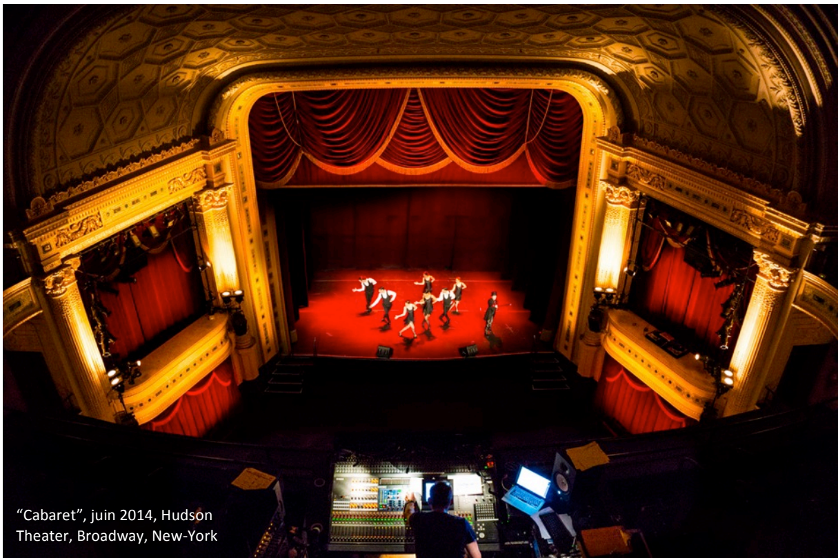
"Cabaret", juin 2014, Hudson Theater, Broadway, New-York

La Compagnie Broadway était à l'affiche de l'Hudson Theater au coeur de Broadway à New York, pour une soirée spéciale où elle a présenté un spectacle inédit, créé pour l'occasion. Une consécration pour cette troupe suisse qui voit là une reconnaissance internationale de son professionnalisme et de son talent.