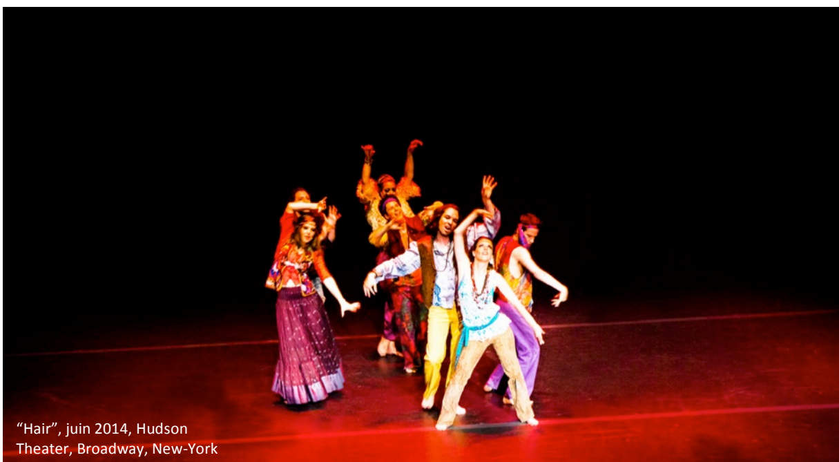
"Hair", juin 2014, Hudson Theater, Broadway, New-York